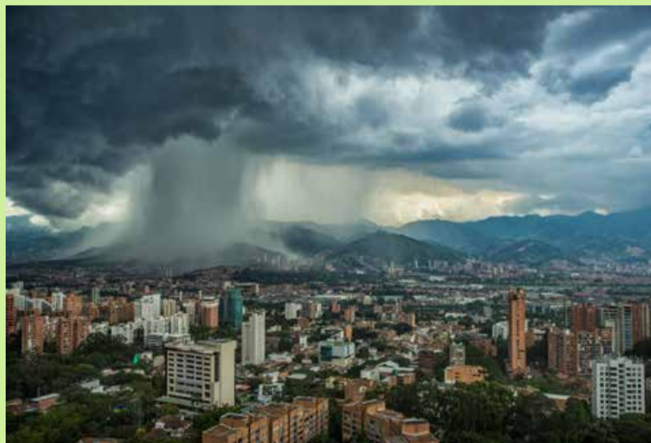
1er puesto: Tormenta | Edinson Ivan Arroyo Mora | Colombia

18 Países participantes 6 Jurados internacionales 2821 Interacciones en redes sociales 12 Finalistas 3 Premios