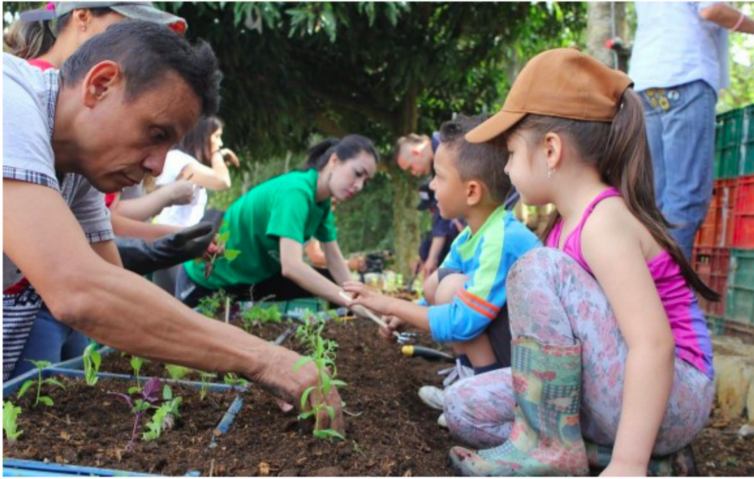
En el barrio Trianón, de Envigado, se han adelantado actividades en el marco del proyecto Barrios Bajos en Carbono.